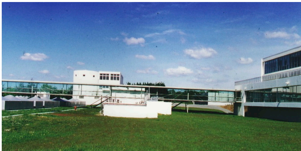
Vues sur la passerelle