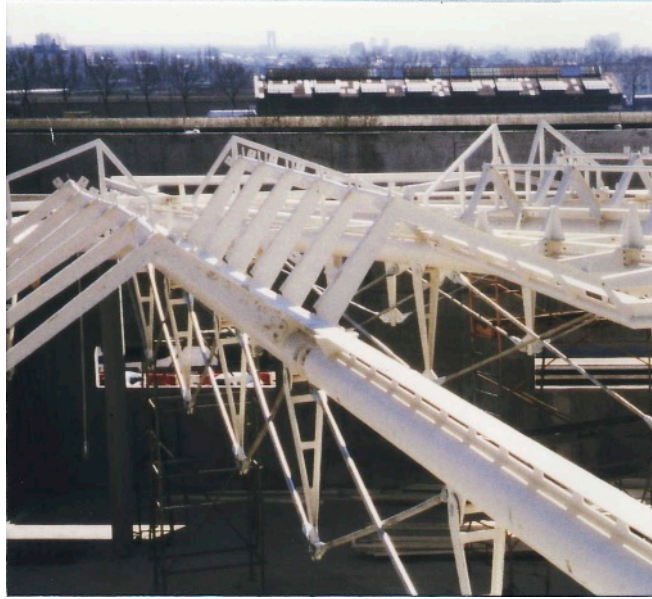
Charpente métallique et chêneaux